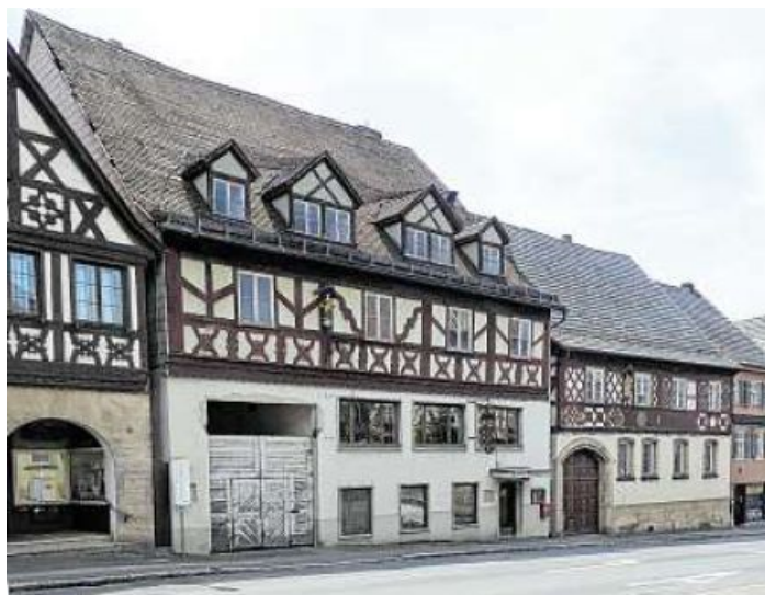
Die denkmalgeschützten Gebäude des Areals am Marktplatz.

Dank eines Fauxpas beziehungsweise einer unsauberen Beschreibung konnte auf der Denkmalschutz zuletzter der Eindruck entstehen, die Stadt denke daran, das ihr gehörende Bären- und Ultschen-Gelände zwischen Marktplatz, Horsdorfer Straße und Alter Schießstätte im Gesamten zu veräußern und nicht nur den vorderen, denkmalgeschützten Bereich. Verantwortlich war die Stadt nach eigenen Aussagen für dieses Missgeschick nicht, doch könnte es denn mittlerweile eine Idee sein, das 3300 Quadratmeter zählende Filetstück im Herzen der Altstadt wirklich komplett anzubie-