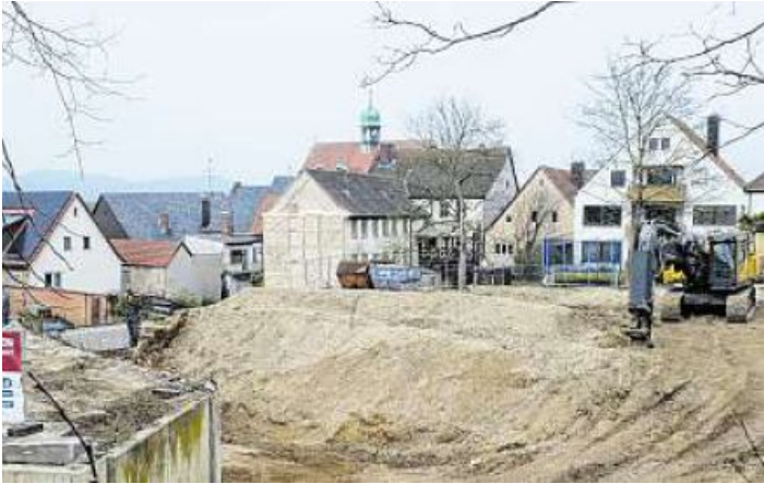
Filetstück im Herzen der Adam-Riese-Stadt.