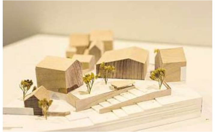
So könnte es auf dem Bären-Areal einmal aussehen.