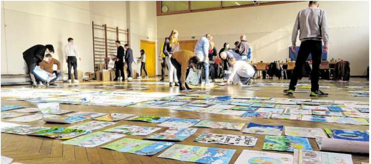
Die zwölköpfige Jury sucht aus den 809 Bildern die besten 75 auf Kreisebene aus.