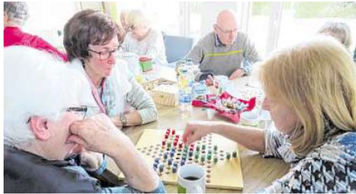
Zum „Spielesachmittag“ kann jeder sein Lieblingsspiel mitbringen.

Das zweite Angebot ist neu: ein Spielenachmittag. Er soll einmal monatlich stattfinden, ebenfalls mittwochs. „Bringen Sie doch ihr Lieblingsspiel mit!“, lautete der Aufruf in den Zeitungen und im Adam-Riese-Boten. Das ließen