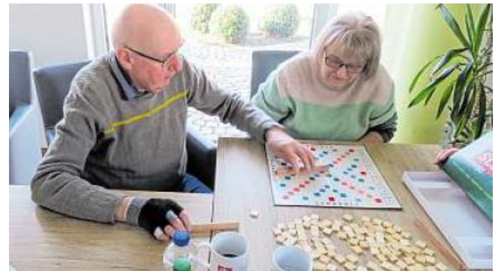
Spielenachmittag in Bad Staffelstein: Halma oder Uno spielen macht Spaß.

Gesundheitsteam Bad Staffelstein medizinischer Fachhandel · Hilfsmittelversorgung ...Ihr Partner vor Ort