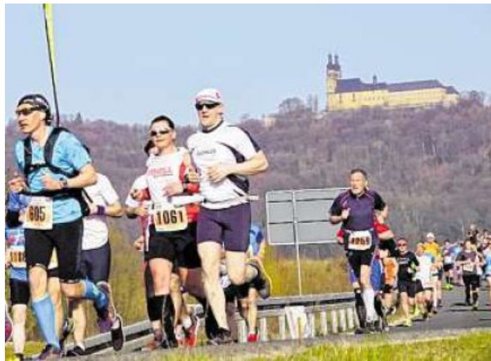
Laufsportbegeisterte dürfen sich auf den nunmehr 18. Obermain-Marathon freuen.